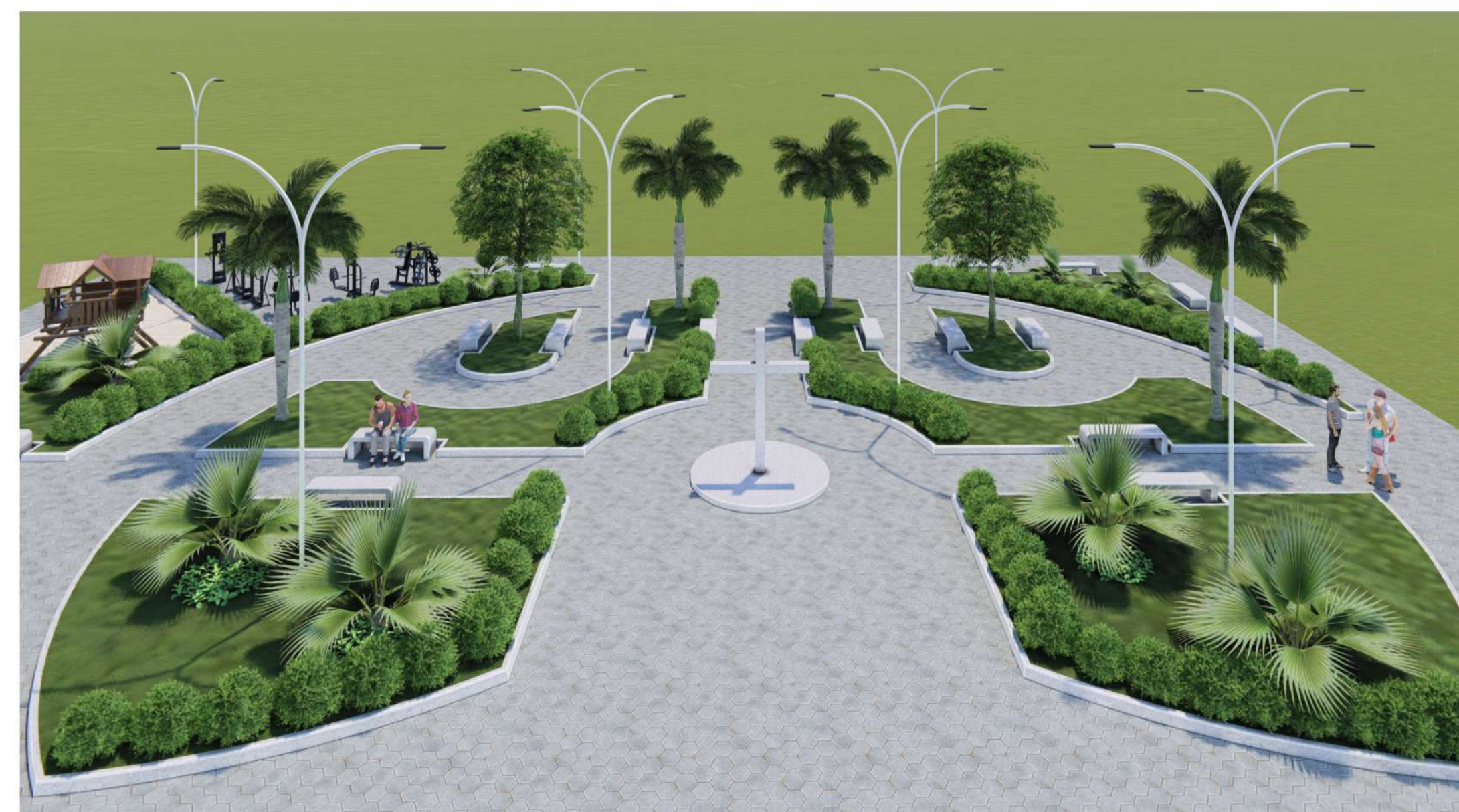
4 RENDER ESCALA: 1:350