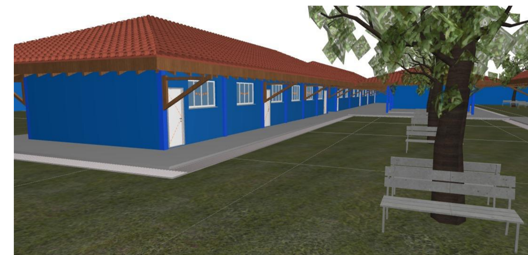
VISTA DOS BLOCOS POSTERIORES - SEM ESC