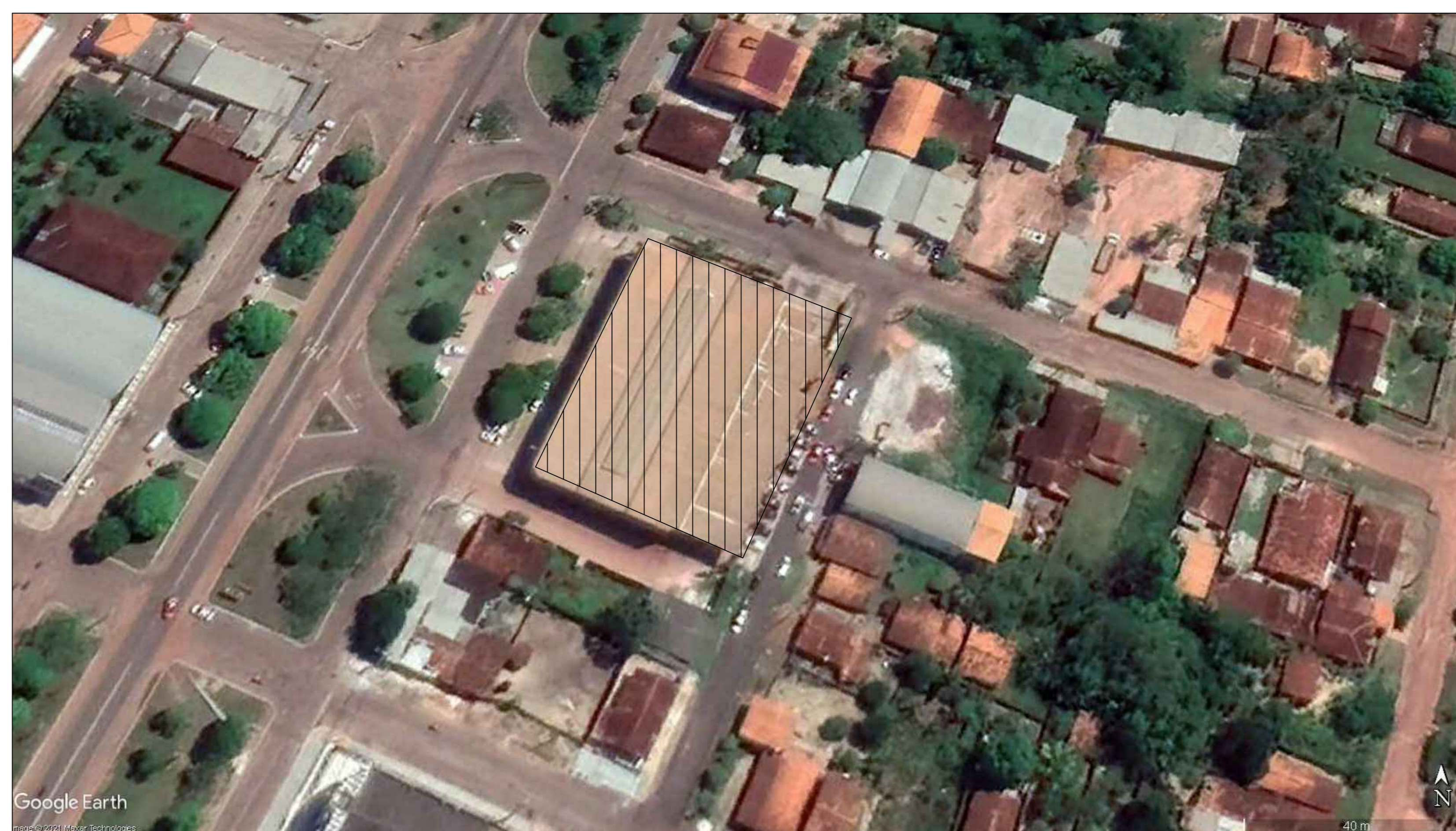
MAPA GOOGLE EARTH - S/ESC.

PROPRIETARIO: PREFEITURA MUNICIPAL DE MÃE DO RIO