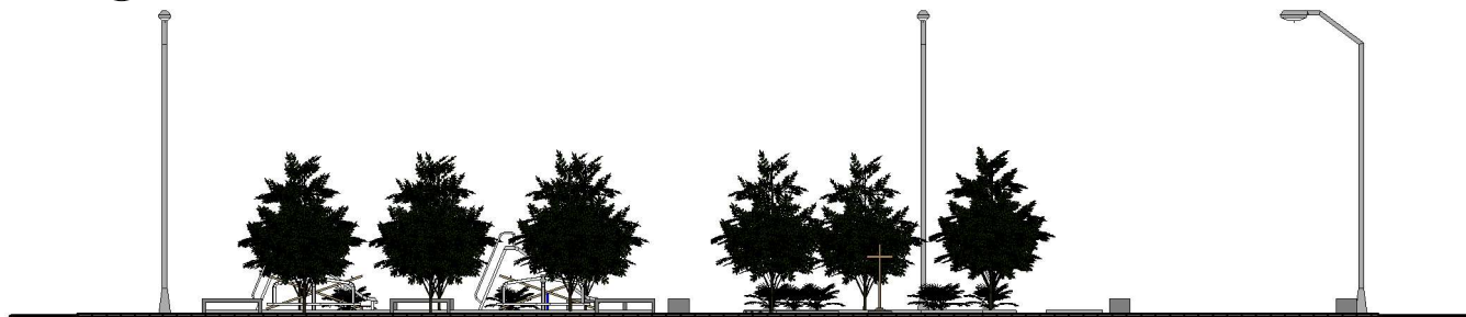
2 FUNDOS 1 : 250