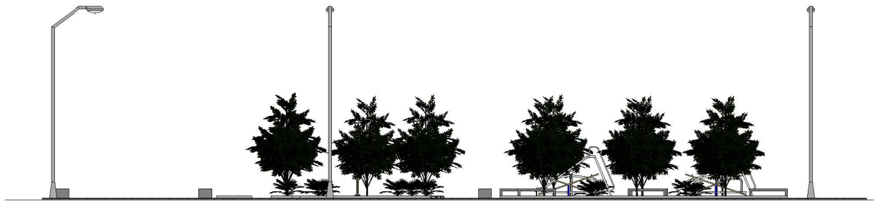
1 FACHADA 1 : 250