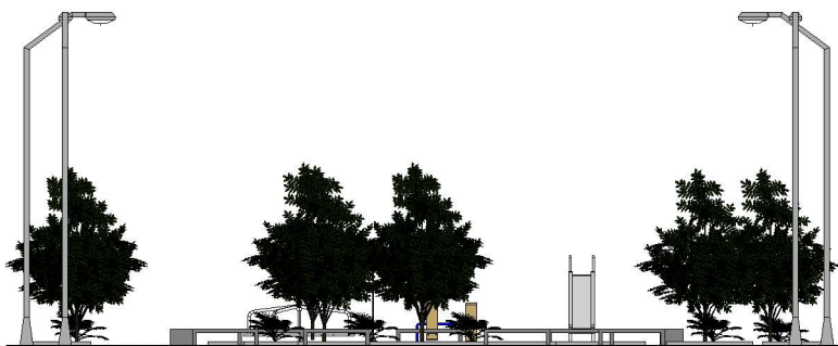
4 LATERAL ESQUERDA 1 : 225