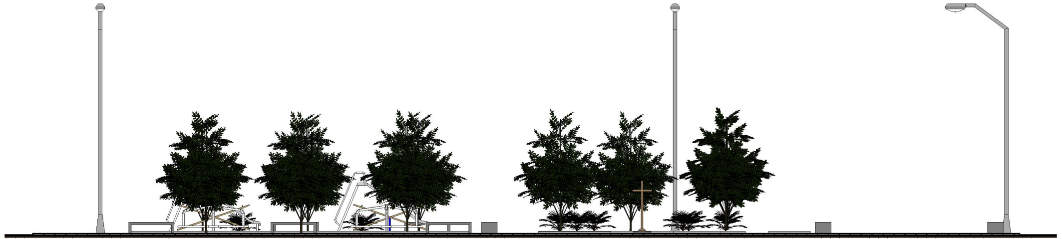
2 Corte 2 1 : 150