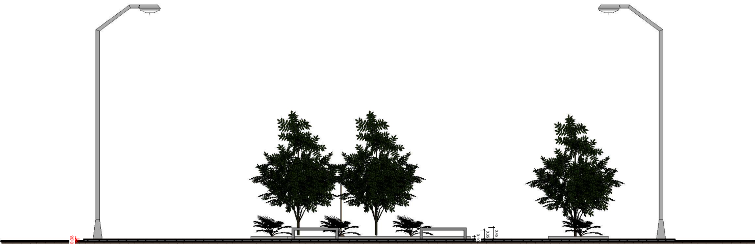
1 Corte 1 1 : 150