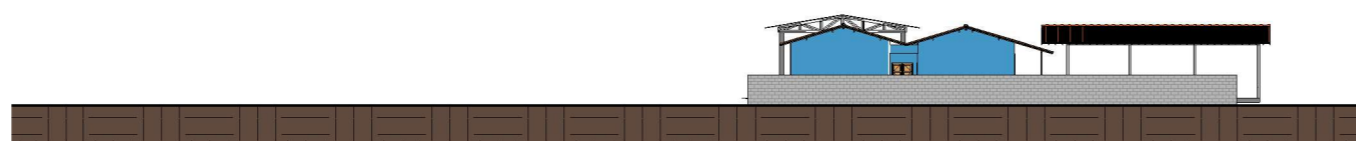
3 LATERAL DIREITA 1 : 500