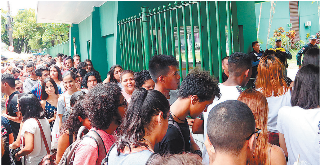
No segundo semestre o P-Fies não terá mais limitação por renda, mas será cobrada nota mínima na redação do Enem

qualquer momento do ano. No primeiro momento do P-Fies, foram 150 mil vagas. No ano passado, foram 450 mil.