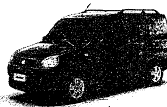
Imagem meramente ilustrativa técnicas descritas.

"O Fiat Doblò, desde o seu lançamento, é referência em seu segmento. Seu conjunto funcional e versátil proporciona conforto para todos os seus passageiros e prazer ao dirigir. O generoso espaço interno para até sete ocupantes o torna um "Family Car" e aumenta o desejo dos consumidores."